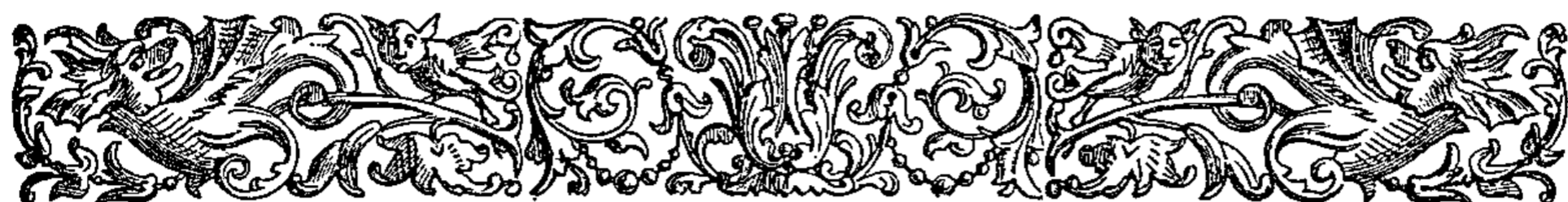
TABLE ALPHABÉTIQUE 1